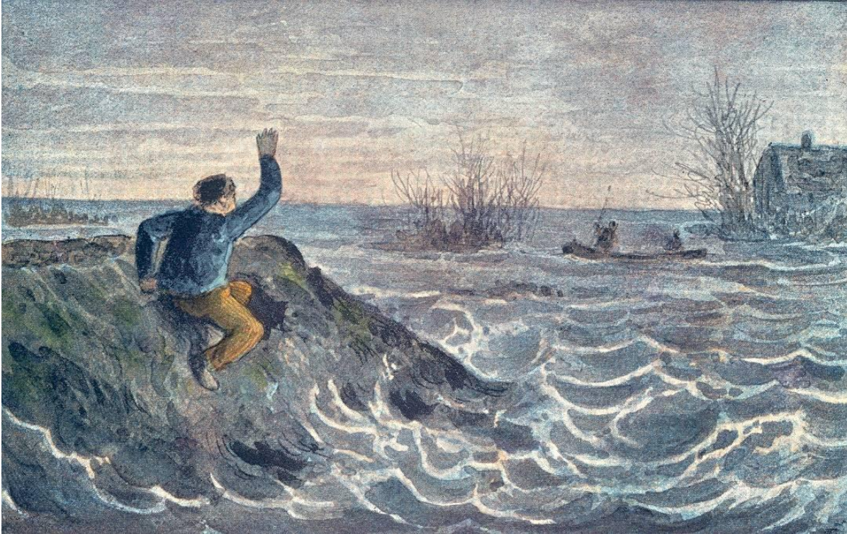
Redding met kleine boten.

water staan. De evacuatie van achtergebleven mensen per boot wordt dan het laatste redmiddel. In het middeleeuwse en vroegmoderne landschap bestonden weinig obstakels als het landschap eenmaal overstroomd was, en varen over overstroomd land was dus een realiteit.